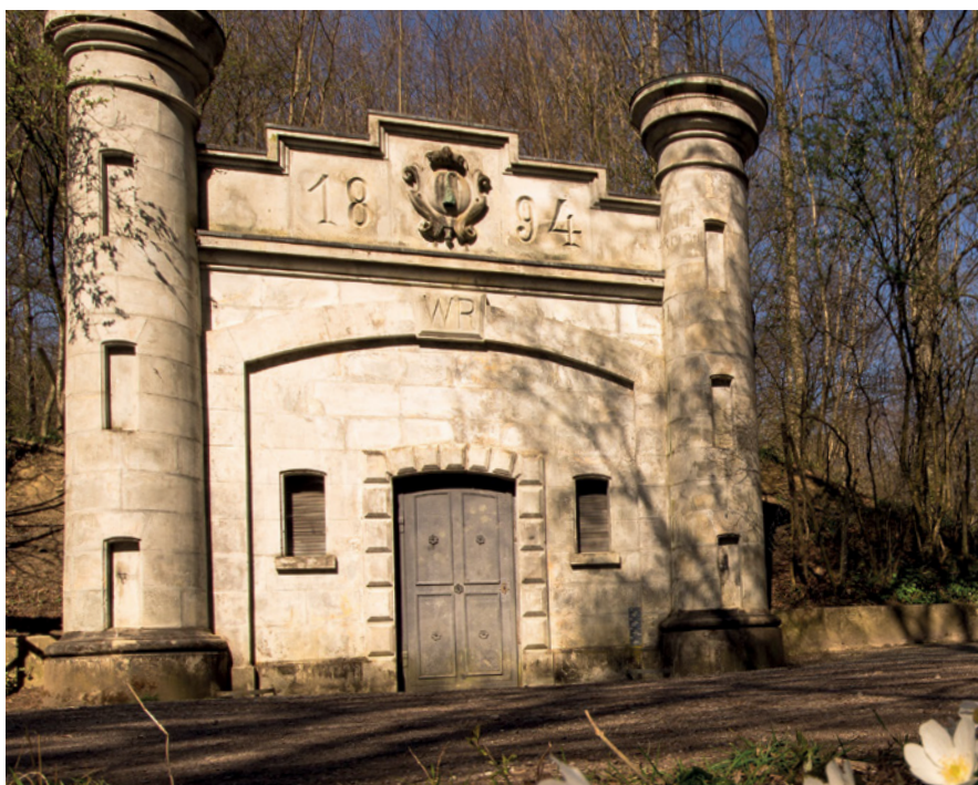
Ehemaliges Wasserreservoir im Romanshorne Wald.

Die Anstrengungen der vergangenen Jahre machen sich nun auch kostenseitig bemerkbar und wir freuen uns, die Preise für den Trinkwasserbezug senken zu können.