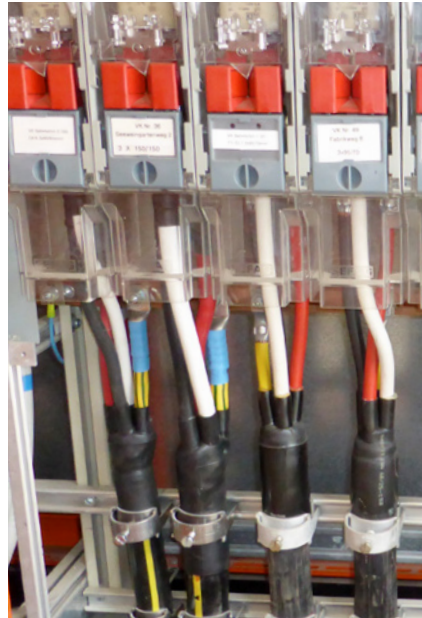
Niederspannungsverteilung einer Trafostation.

Haushalt mit 4'500 kWh Stromverbrauch pro Jahr bringt dies eine Kostenreduktion für die Energie von –3,4% (AKW-Mix), –5,9% (Basis-Mix) oder –10% (Natur-Mix).