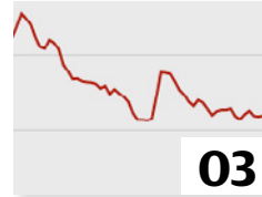
Strompreise 2015. Seite 3