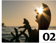
Trinkwasserinformation 2013. Seite 2